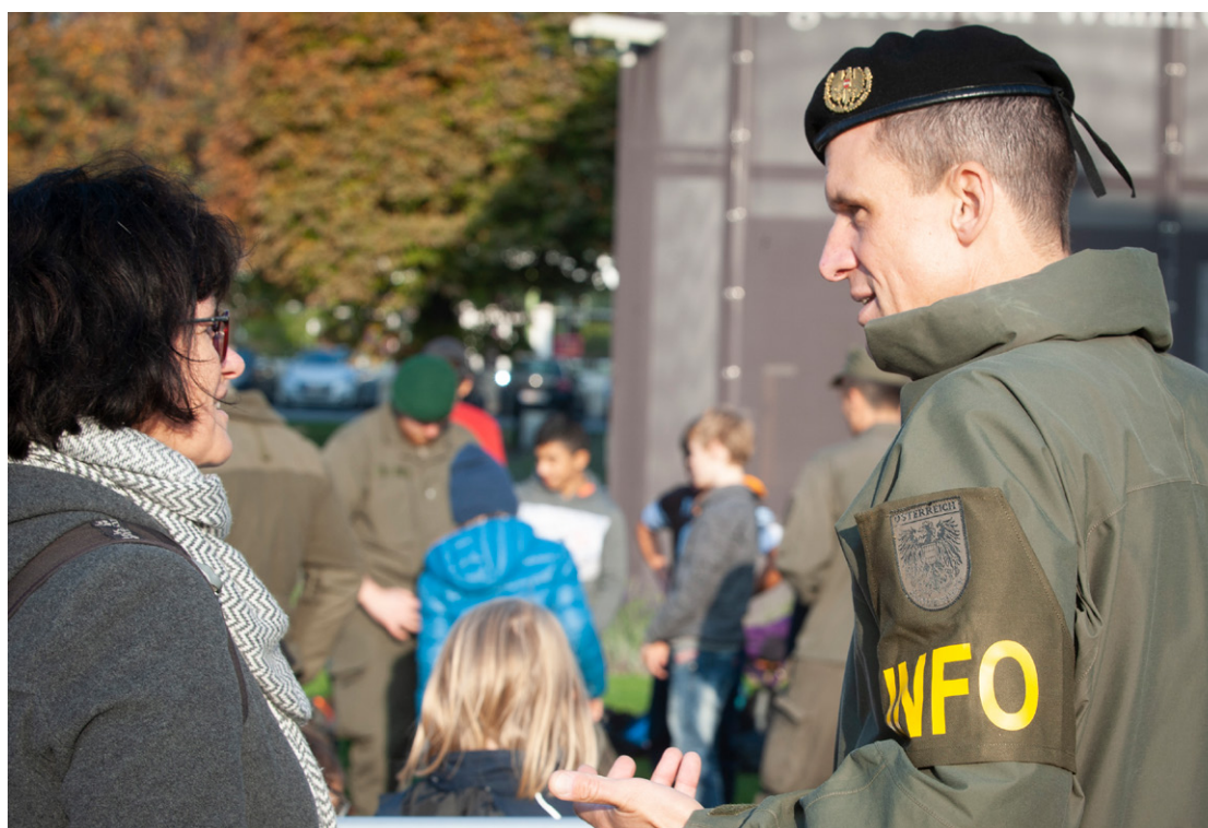
Unten: Geistige Landesverteidigung liegt in der Verantwortung des Bildungsministeriums. Das Bundesheer unterstützt durch speziell ausgebildete Informationsoffiziere.