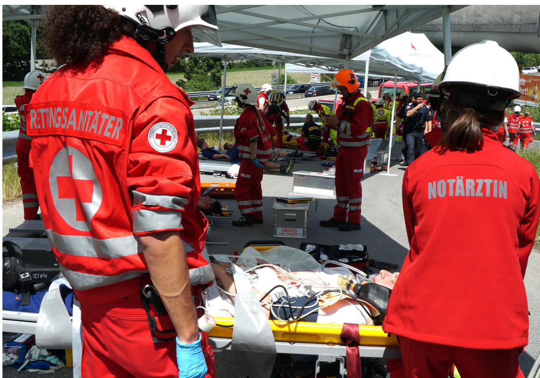
Oben: Gemeinsame Übung ziviler Rettungs- und Einsatzorganisationen und des Bundesheer zur Bewältigung einer Großschadenslage.